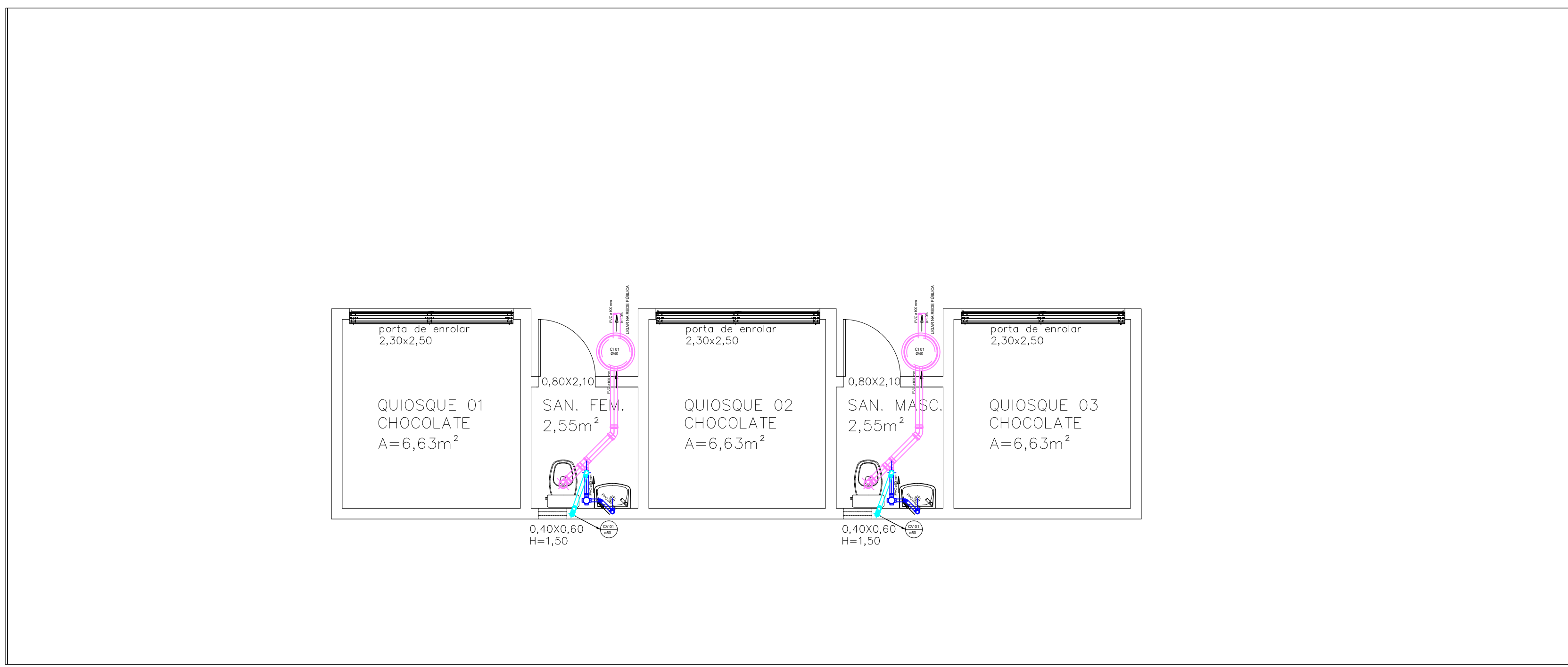
QUIOSQUE - PLANTA BAIXA 1/50